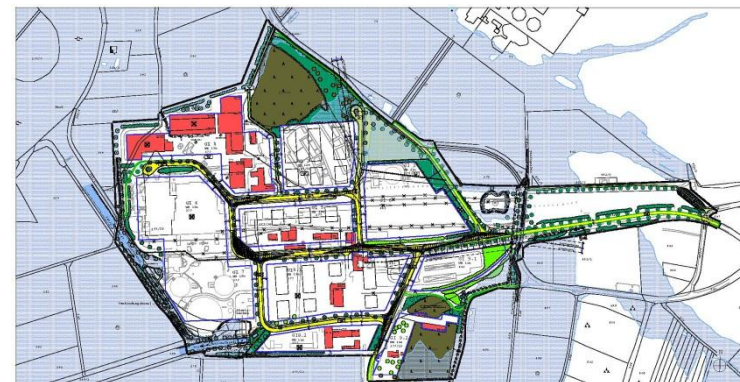
Umstrukturierungsplan des Kraftwerks Schwandorf

Auf dem westlichen Teil des Blockes wird von E.ON Bayern ein Bioheizkraftwerk errichtet. Die nördlichen Teile der ehemaligen Werksiedlung sowie die Aufstandsfläche der ehemaligen Ascheabsetzbecken werden in absehbarer Zeit als Lagerfläche genutzt. Werden die übrigen Flächen bis 2012 nicht durch die E.ON Kraftwerke GmbH veräußert, gehen diese auf Grundlage eines Rahmenvertrags mit der Stadt Schwandorf in deren Besitz über. Somit ist bereits mit dem nahenden Abschluss der Sanierung des alten Industriestandorts und der Folgeentwicklung zu einem Gewerbestandort ein wesentlicher Teil des ehemaligen Betriebsgeländes einer neuen Nutzung zugeführt.